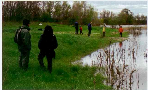
≡ Recorridos por las riberas.

máximo apogeo en estas secas tierras del suroeste de la provincia. En Aragón, el Balneario Sicilia fue uno de los pioneros en buenas instalaciones y en los años 70 comenzó a abrir todo el año. Hoy modernas, luminosas y tranquilas instalaciones con alojamiento incluido nos permiten el baño en piscinas y aguas calientes –que manan a una temperatura de entre 34 y 37 grados- indicadas en el tratamiento de diferentes dolencias como afecciones de la piel, a las vías respiratorias, problemas digestivos y, sobre todo, que sirven para paliar el mal moderno del estrés diario al que están sometidas nuestras vidas.