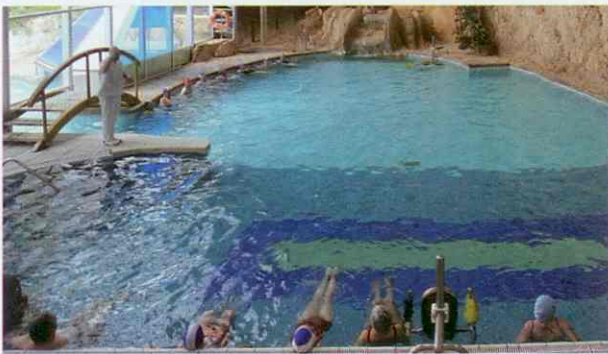
≡ Balnearios de aguas curativas.

La provincia dispone de cinco balnearios, todos ellos emplazados en tres puntos de la comarca de la Comunidad de Catalayud: el balneario de Paracuellos de Jiloca, las Termas Pallarés de Alhama de Aragón, y los balnearios de La Virgen, Sicilia y Serón en Jaraba, junto al cañón del río Mesa.