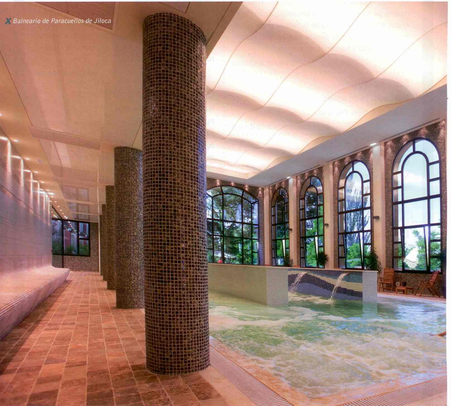
X Balneario de Paracuellos de Jiloca