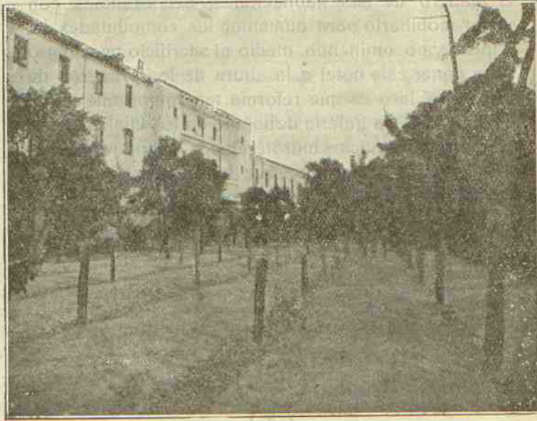
Un pasec. de los Parques